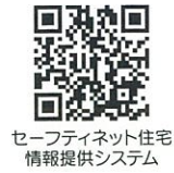
セーフティネット住宅 情報提供システム