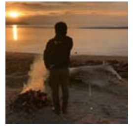
●サップテラスの方と清掃