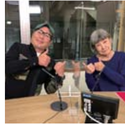
●ケーブルテレビ局