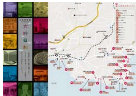
●大神海岸線ショップ案内リーフレット表