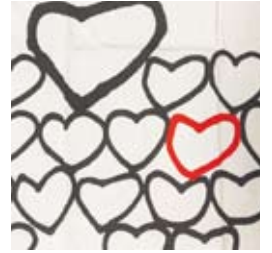
●ボランティアタオルデザイン