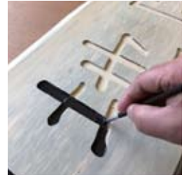
●文字の彫り込みにスミ入れ