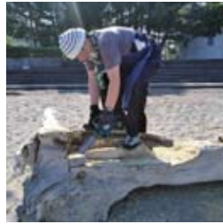
●チェーンソーで削りはじめる