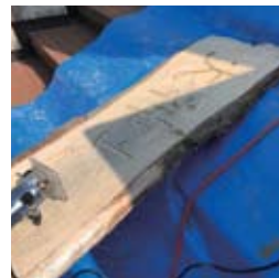
●銀杏の木に文字を彫り込む