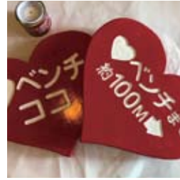
●ラブベンチ誘導看板製作