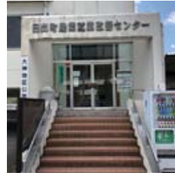
●以前の公民館入口