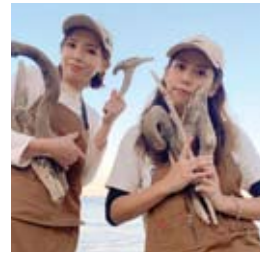
●海岸清掃・流木集め