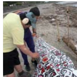
●大神の学生さんペイント