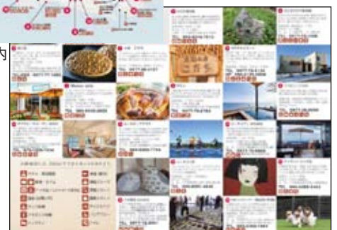
●大神海岸線ショップ案内リーフレット裏