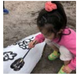
●海岸に遊びに来た親子に下書きをしていただきました