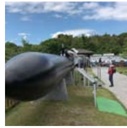
●回天大神訓練基地記念公園