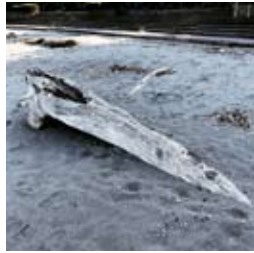
●海岸に打ち上げられた12mの銀杏の木