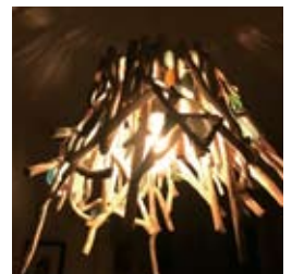
●流木作品ランプシェード