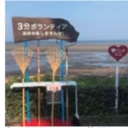
●3分ボランティア什器