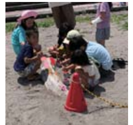
●キャンプ親子とペイント