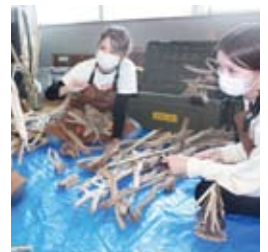
●流木作品制作風景