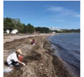
●海岸清掃ボランティア