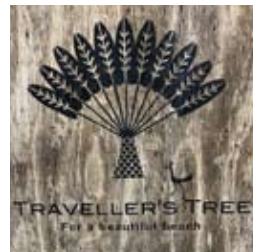
●トラベラーズツリー看板