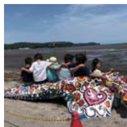
●キャンプに来ていた子供達