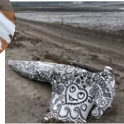
●防腐剤。白でペイントし下書き