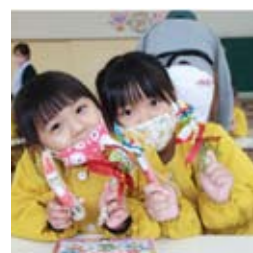
●日出幼稚園児ワークショップ