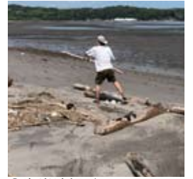
●海岸清掃ボランティア