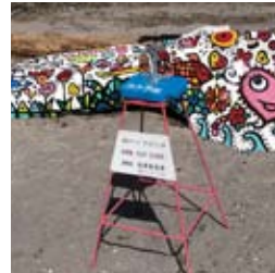
●カメラスタンド製作・設置