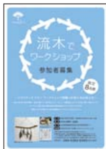
●ワークショップフライヤー