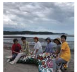
●大神海岸線メンバー