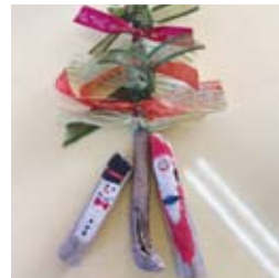
●クリスマスオーナメント