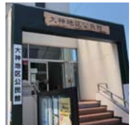
●大神地区公民館看板設置