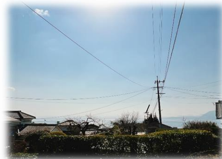
物件前からは別府湾を眺めることができます