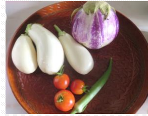
外出が多く、ほったらかしではじめて畑に実った野菜たち。感謝(>_<)...

また、野菜はあすみ農園で採れた新鮮なものばかり。美味しいご飯は自然と無口…。デザートには、アイスにかぼすを絞るといいう食べ方を初体験。食べてみるとめっちゃ美味しー！秋にはかぼすポン酢作りが行われる予定です。