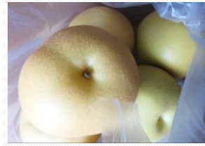
日出の梨が美味しい！農家さんの産直では、おまけがもらえるところも嬉しい。