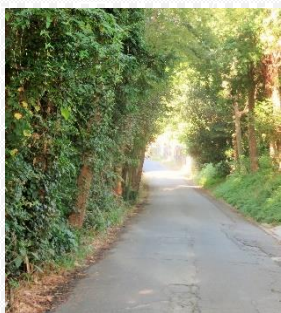
いつも通勤に通るこの緑のトンネルが大好き。

地域の方々に支えられて、日出町の協力隊として2年目に入りました。成人ソフトボール大会に参加した後、一週間筋肉痛を引きずったこともいい夏の思い出です… 大神地区に慣れ親しみ、鳥よけの空砲も日常の音で気づかないくらいです。1年前には考えられなかった豊かな今があります。