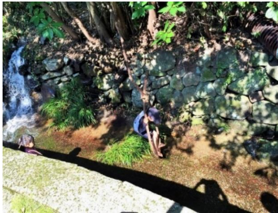
天然素材のフランコ。水の上をぶらーん

この日はそつめん流し、スイカ割りも楽しみました。大勢の人達が遊びに来てくれたらいいな、とおっしゃっていましたよ。地域の方々が整備した隠れ家なので、遊んだ後のゴミは持ち帰りましょうね。