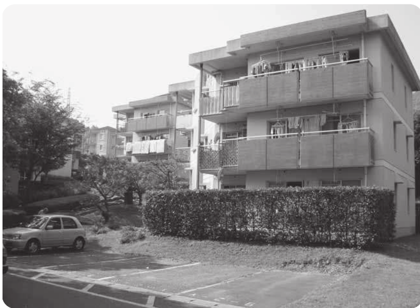
入居希望者が多い仁王住宅

問 子育て中の若い世代や、低所得であえいでいる町民にとって家賃の負担は大きい。老朽化を理由に募集を停止している日出町の現状は、入居基準を満たしている町民が行政サービスを受けることができない状況をまねいています。これによいのか！一日も早く建設計画を展開し、入居対