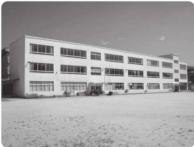
耐力度はどのくらい？（豊岡小学校）

広域行政窓口サービスの一環として大分、別府、中津、杵築、由布の各市と九重町との協定により