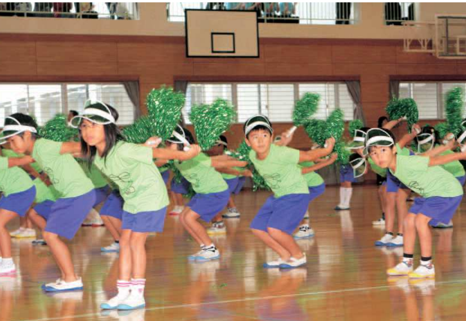
国体なぎなた総合優勝に花を添える大神小学校1・2年生