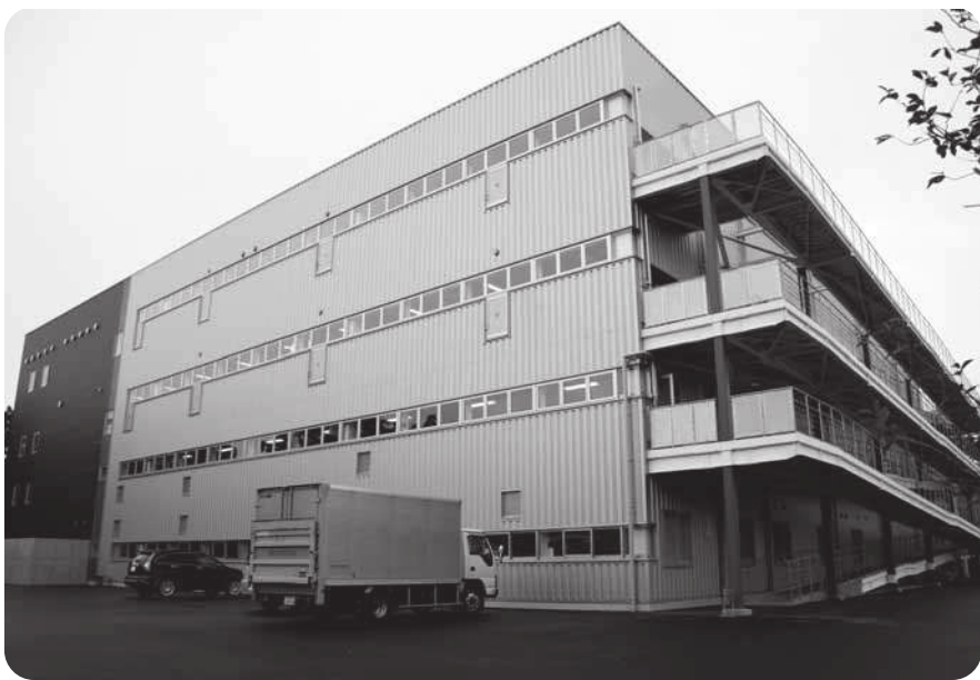
企業誘致の専門職員を配置（ホンダ太陽工場増築）

町長 まちづくり交付金事業で推進し18年度から22年度までの5年間を経過にして総事業費5億6千万円から7千万円の事業費を見込み計画して