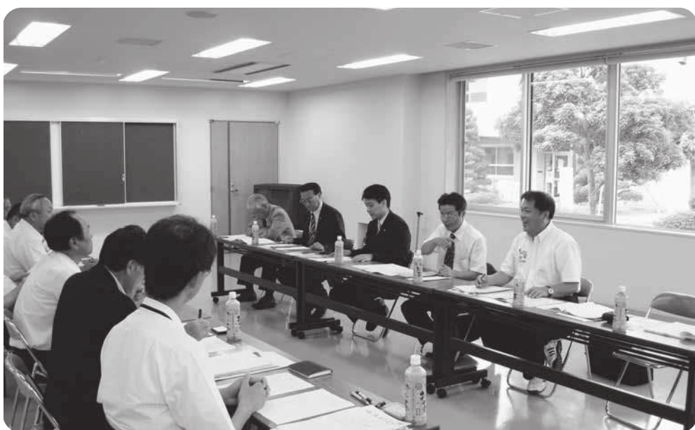
議会報編集のノウハウは（能勢町）

集や構成にとられず、よりいっそう町民の皆さんに親しまれる、また読んでいただける「議会だより」を目指し、刷新に取り組んでいきたいと思