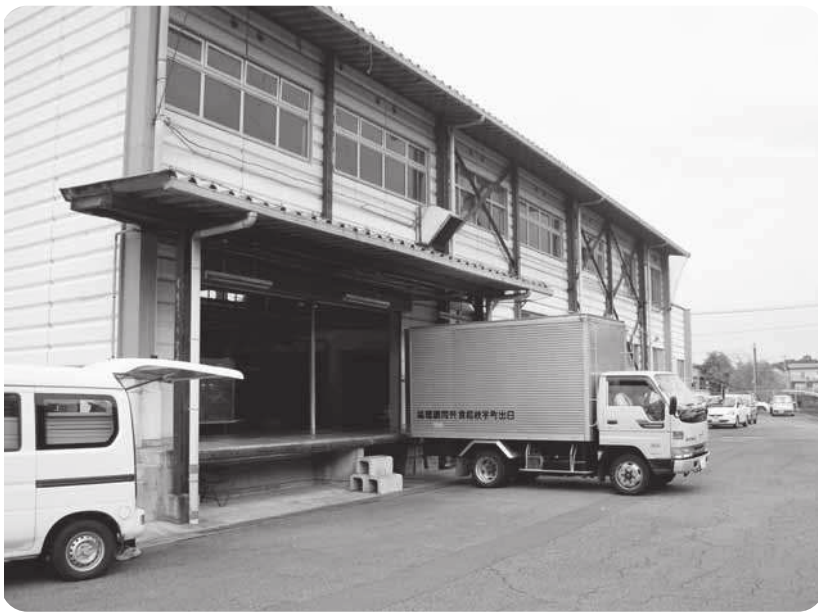
問題が山積している給食センター

ただ、町民の皆さんの意向次第だと思っています。コンセンサスが得られれば可能です。