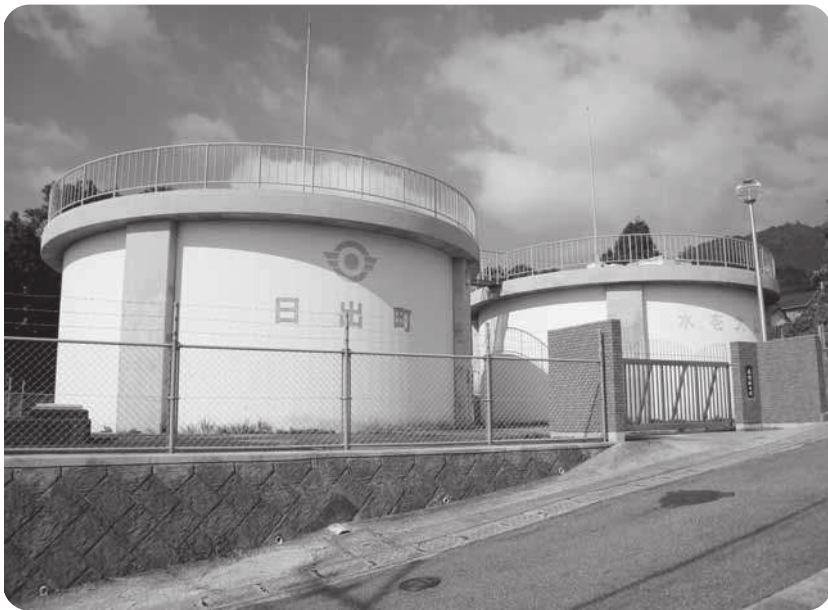
安全な水の供給に努めています（長野配水池）

5093万円となっております。そして当期純利益と前年度繰越利益剰余金2千万円とあわせて、7093万円が19年度の未処分利益剰余金となります。この剰余金のうち3093万円は減債積立金に、2千万円を建設改良積立金に、残りの2千万