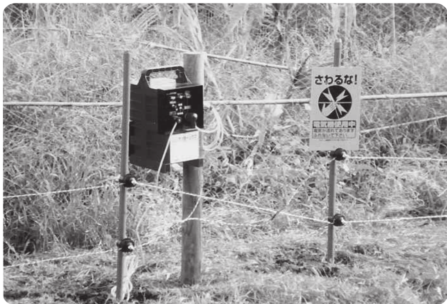
イノシシは進入禁止（電気柵）