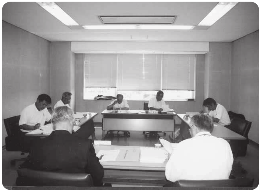
ひとつひとつ慎重審議する総務常任委員会

議員の報酬および費用弁償などに関する条例などの一部改正は、地方自治法の改正により、全員協議会の活動が正規の議会活動として、明確に位