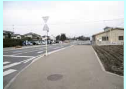
基幹事業: 町道暘谷駅北口線