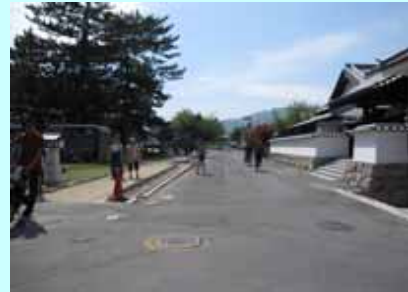
基幹事業: 町道二の丸南浜線