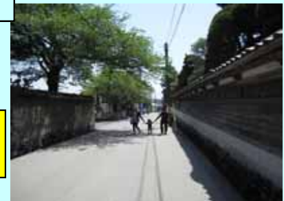
基幹事業: 町道二の丸南浜線(的山荘)