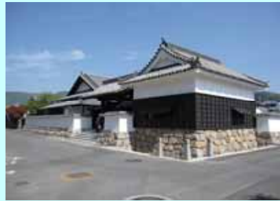
基幹事業: 観光交流センター