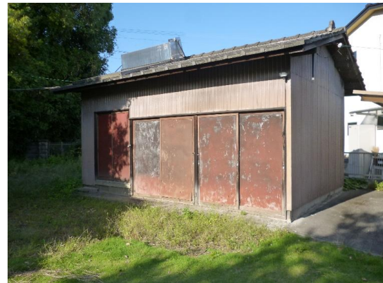
〈 倉 庫 〉