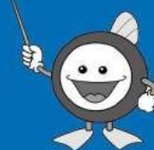
下水道マスコット 『スイスイ』