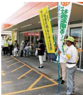
街頭啓発活動の様子