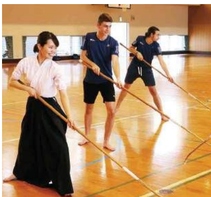
先生の動きに合わせてなぎなたを体験

2日目からは、町内の各家庭にホームステイし、町内のスポーツ少年団などと交流。7月30日には5日間の滞在を終え、次の訪問先へと旅立ちました。