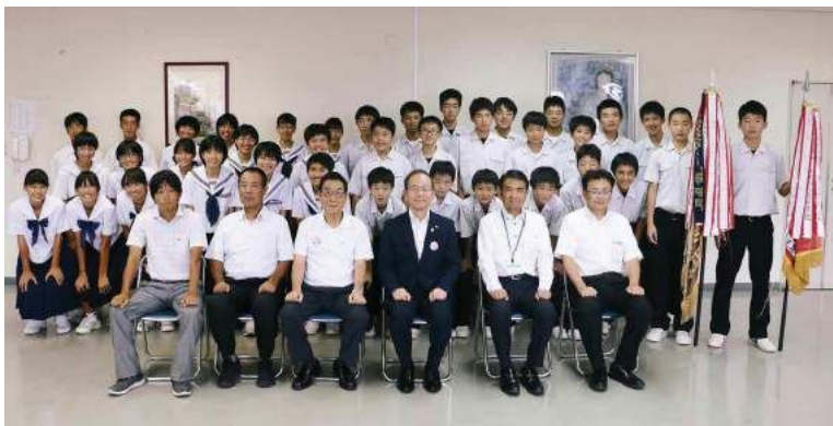
本町町長、堀教育長と一緒に記念撮影する両中学校の生徒ら