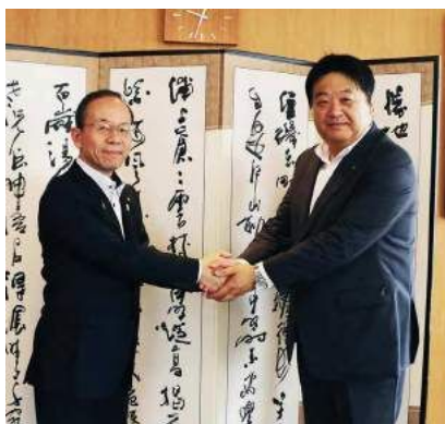
握手を交わす山田町長（右）と本田町長