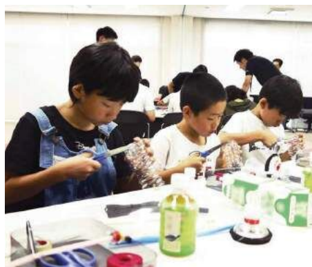
ヘッドホンを作る参加者ら

7月27日、大神地区のソニー・太陽(株)で理科実験教室（ヘッドホン作り）が開催されました。この教室は同社の主催で、子どもたちが科学に興味を持つと同時に、障がいのある同社員と交流することを目的として実施しているもの。