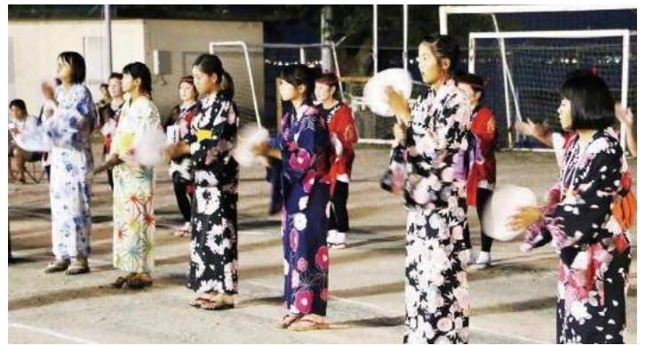
華やかな浴衣姿で踊る参加者ら

盆踊りの後の花火大会では、約900発の花火が打ち上げられ、夏の夜空を彩りました。