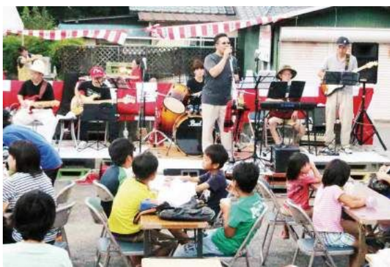
特設会場で行われたバンドの生演奏

また、同会場では、餅まき・菓子まきや、お楽しみ抽選会などが行われ、来場していた子どもたちは大はしゃぎ。ステージではバンドによる生演奏も行われました。夜には、花火大会も行われ、来場者らは楽しい夏の夜を過ごしていました。