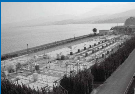
日出町浄化センター

下水道は、家庭や工場などから排出された汚水を終末処理場できれいにし、川や海に戻すことで、川や海の水質環境保全、そして私たちの衛生的で快適な生活を支えています。また、近年では終末処理場での下水の処理過程で発生する汚泥を再利用するなど、地球にやさしいリサイクル型社会の推進にも貢献しています。