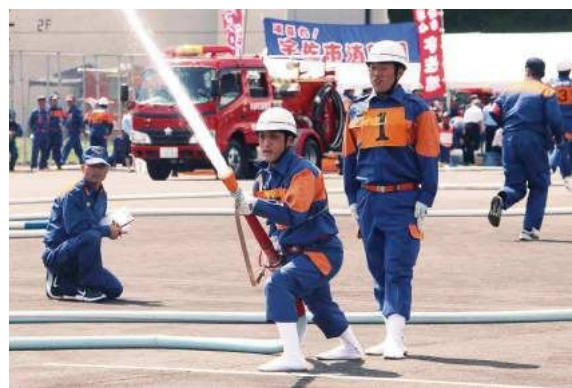
火点（的）を目標に放水を行う様子

8月19日、第30回大分県消防操法大会が、大分県消防学校（由布市）で行われました（同大会は2年に1度の開催）。