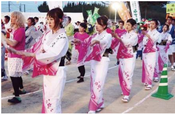
日頃の練習の成果を発揮

参加者は、三つ拍子、二つ拍子、六調子、左衛門のそれぞれを踊りました。日頃の練習の成果を発揮しようと、参加者の表情は真剣そのもの。