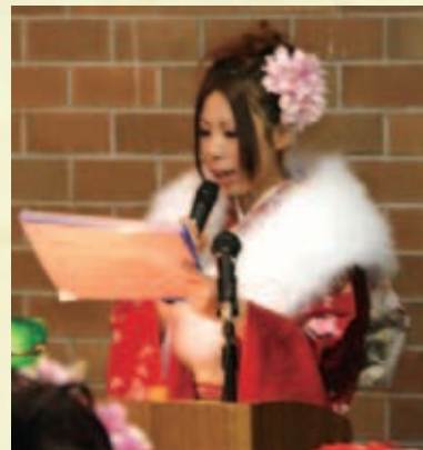
「これまで親に頼っていたので自立するだけでなく周りの人も支えていきたい」 「実行委員としてみんなの意見をまとめるのが大変だったけど、今日はみんなの協力でうまくいったと思います」