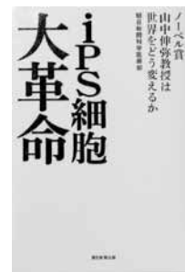
「『iPS細胞大革命』 ノーベル賞山中伸弥教授は 世界をどう変えるか」 朝日新聞科学医療部：著 朝日新聞出版：刊

私は横綱になるという父の夢を果たすため、父の分け身としての人生を歩んできた。相撲道、人生哲学、若貴ブーム、家族のこと。「土俵の侍」と呼ばれた平成の大横綱・貴乃花がそのすべてを初めて明かした自伝。