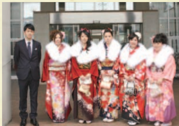
平成 25 年成人式実行委員会の皆さん