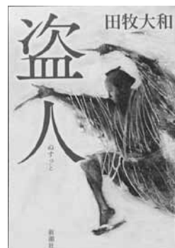
「盗人」 田牧大和：著 新潮社：刊

突然変異で高度な知性を備えたハチやアリの人の代わりに働き、失業者が溢れる街で、おぞましい秘密工場の存在を知った「俺」。悪事を暴く闘いから生還した先に待っていたのは、働きアリの苦渋を味わう絶対服従の日々だった…。