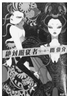
「絶対服従者」 関俊介：著 新潮社：刊

突然変異で高度な知性を備えたハチやアリの人の代わりに働き、失業者が溢れる街で、おぞましい秘密工場の存在を知った「俺」。悪事を暴く闘いから生還した先に待っていたのは、働きアリの苦渋を味わう絶対服従の日々だった…。