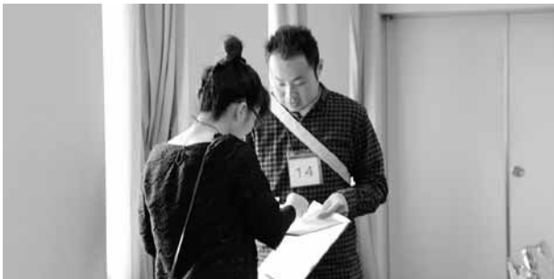
フリータイム。気になる異性に声をかけたり、事前にスタッフから渡されているメールアドレスを書いた紙を渡したり自由に動きます