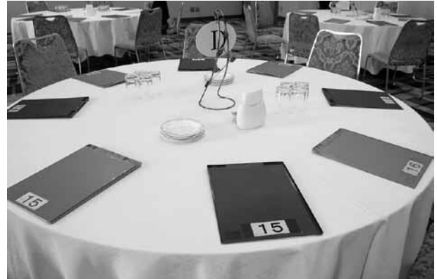
男女交互になった席でテーブルトーク。全ての人と話ができるよう男性が1つずつ席を移動していきます。1人と話す時間はおよそ4分間