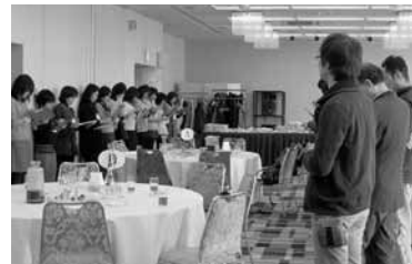
全員とおしゃべりした後、男女別れて向き合います。改めておしゃべりたい人の番号を記入し、スタッフへ渡します