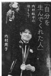
「自分を生んでくれた人」 内村航平の母として 内村周子：著 祥伝社：刊

江戸を揺るがす盗賊集団「幻一味」。だが、一味の面々は、自分たちを仕込み、操る男が誰かを知らない。盗みの裏に隠された本当の目的とは? 「小説新潮」掲載に書き下ろしを加え単行本化。