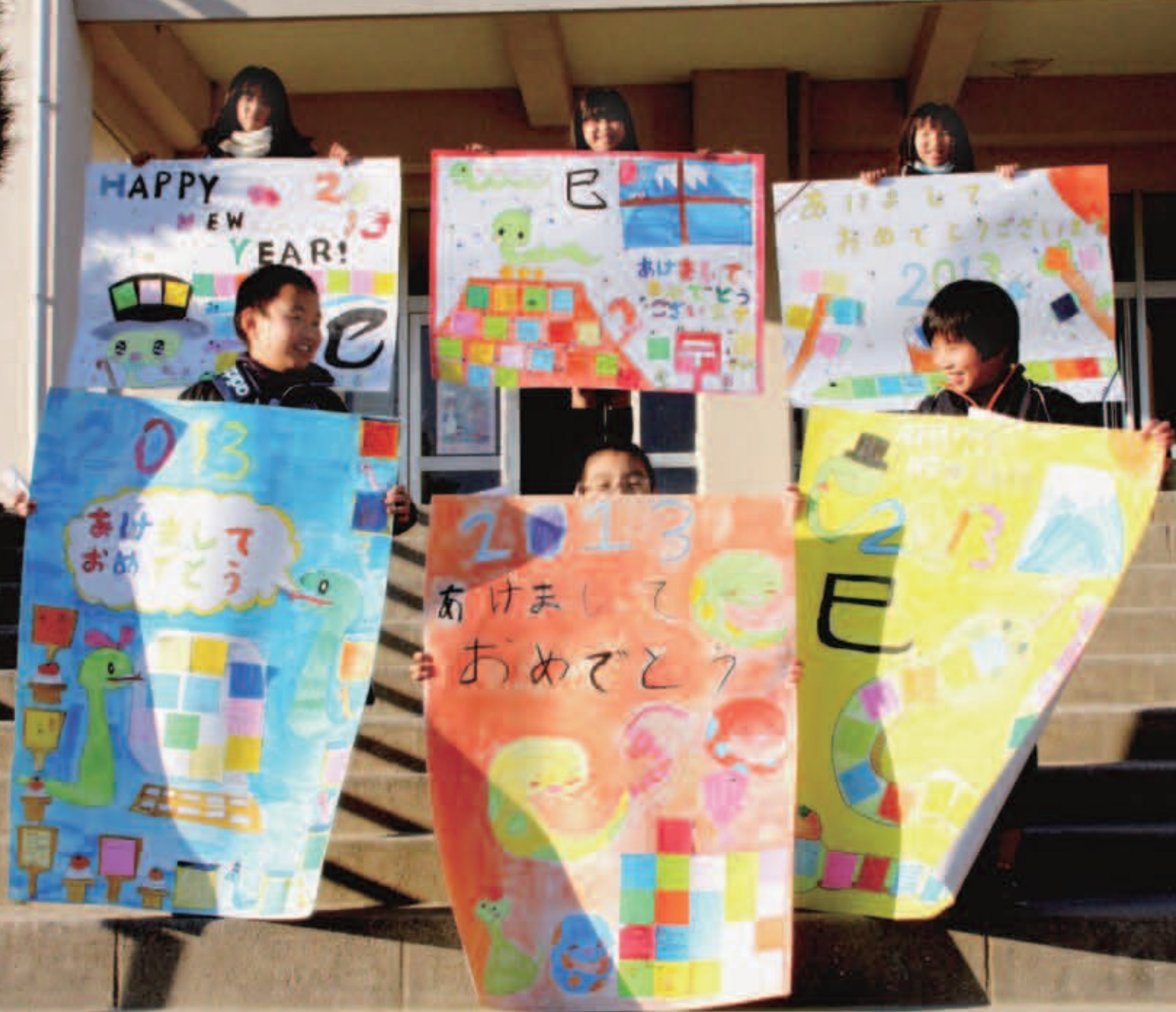
写真は藤原小学校・幼稚園の子どもたちが作ったジャンボ年賀状