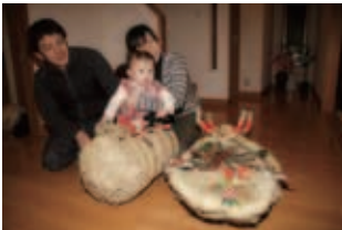
昨年のかせどりの様子

12月中旬、真っ暗な住宅街の一角、倉庫の外灯の下で藁を打つ4～5人の男性。倉庫の右手にある原山公民館の中では20数名の原山ボランティアクラブのメンバーが青々とした藁を束ね、米俵や地域の伝統行事「かせどり」で使う「大足半」作りに励んでいました。