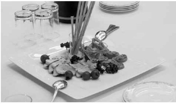
ビュッフェスタイルの食事で会話も弾みます