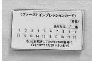
食事の間、スタッフが集計