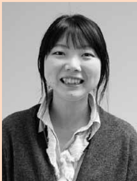
■問合先 政策推進課 ☎ 73-3116

結婚は「ご縁」が大切だと言いますが、この記事をご覧いただいたのもひとつのご縁だと思えます。「出会い応援事業」のことを頭の片隅に置いていただいて、「ご自身はもちろん、どなたかが結婚を考えている」という話の時、役立てていただければ嬉しく思います。 来年度は従来のスタイルのパーティーに加え、イベント体験型の企画や、魅力アップのためのマナー講習会など、より多彩な取り組みを行っていきたく考えておりますので、引き続きご期待ください。ご意見やご要望などもお待ちしておりますので、ふるってお寄せいただければと思います。 このイベントがご縁で結ばれたおふたりが、役場にいらしてくださいる日を、我々は心からお待ちしております。