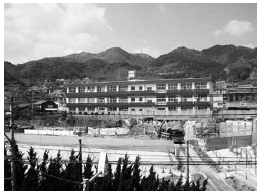
建設中の豊岡小学校