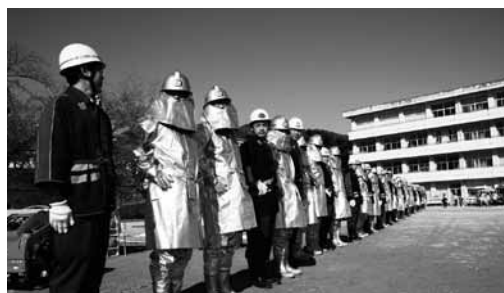
消防出初式の様子