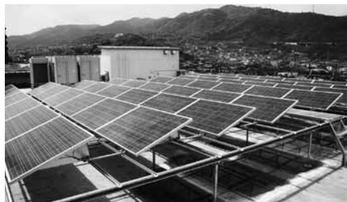
庁舎屋上の太陽光パネル