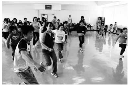
APU学生との交流活動