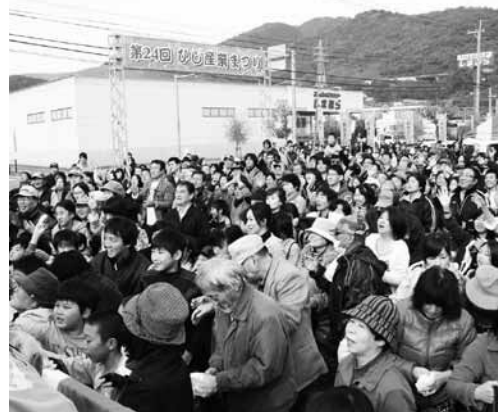
昨年の産業祭の様子