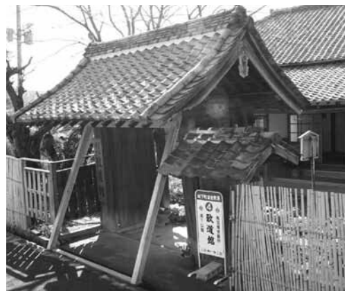
改修を待つ到道館