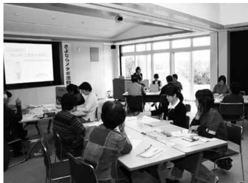
さよならメタボ活動の様子