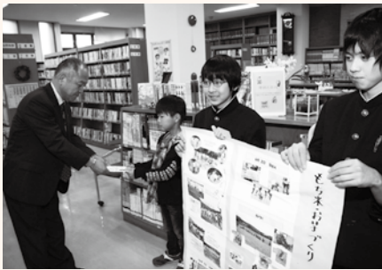
益金を渡す伊藤くん