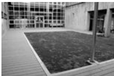
ウッドデッキと芝生を整備した中庭