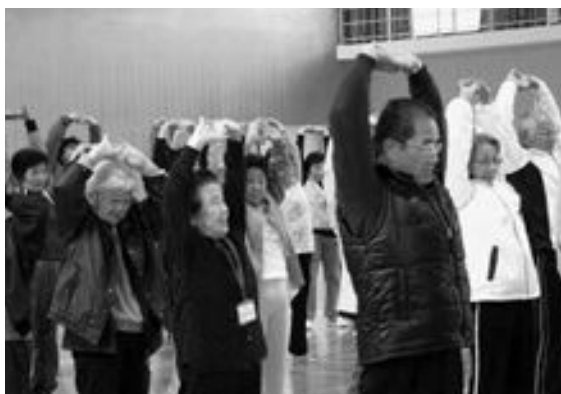
ストレッチをする参加者

月に1回自治公民館で工作やゲーム、音楽療法、運動などを行う教室です。楽しむことで脳に刺激を与え、認知症を予防します。1年間の教室終了後は、自主教室として活動していただきます。