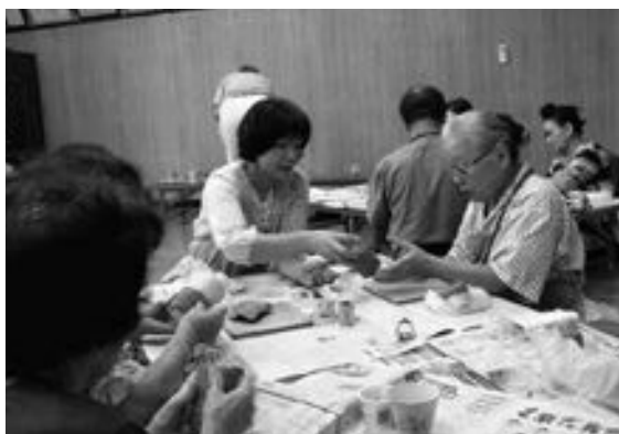
陶芸を楽しみながら脳を刺激

将来、寝たきりや要介護者にならないためには、運動や生活習慣の改善を行ったり、気の合う仲間をつくるなど、心と体の健康を高めていくことがとても大切です。そのためにも、身近な健康づくりの場が必要だと考えています。ご自身の地区で介護予防教室や健康教室が開催される際には、ぜひ参加してください。