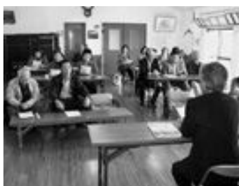
町政ふれあい講座の様子