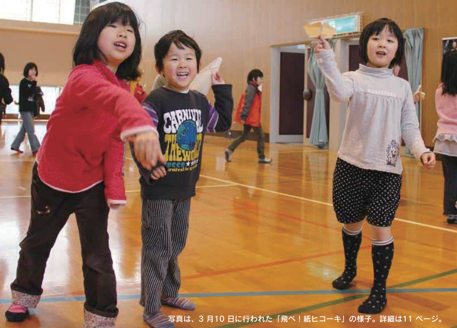
写真は、3月10日に行われた「飛べ！紙ヒコーキ」の様子。詳細は11ページ。