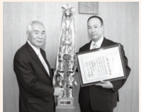
ワールドカップ出場を目指す