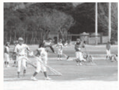
グラウンド整備をする小学生