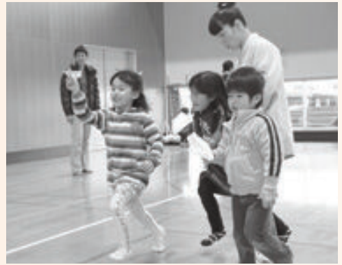
紙ヒコーキで遊ぶ子どもたち