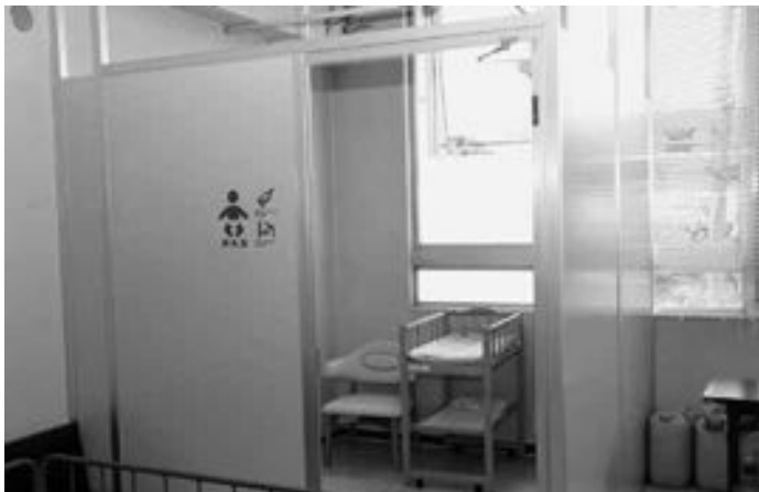
住民課横に設置した授乳室

役場の庁舎内に授乳室を設置しました。おむつ交換台や授乳イス、温水器付シンクを備え付けています。また、中央公民館児童室にも授乳室を設置しています。