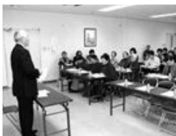
移動町長室の様子