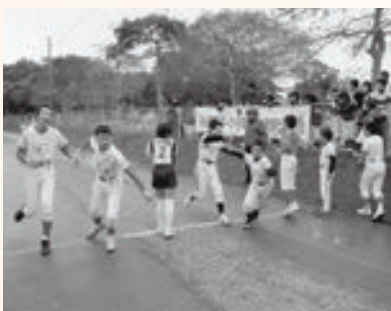
タスキをつなぐ子どもたち