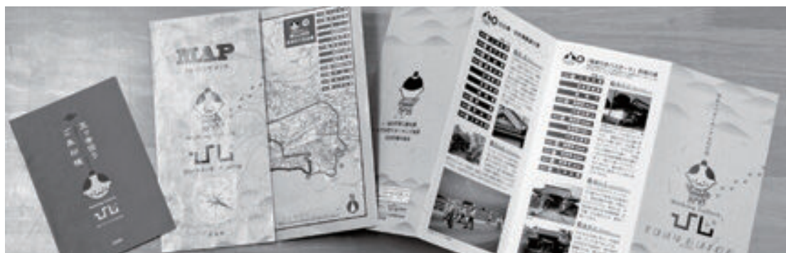
二の丸館にパンフレットを置いています

同協会では、日出町にウォーキング文化を根付かせようと、今後も地区ごとに特色あるウォーキングコースを設定していく予定です。