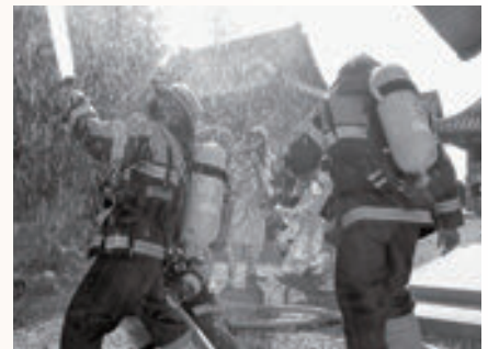
放水訓練をする消防署員

1チーム4人で構成し、敵チームが弾いた直径120cmのボールを4人が協力し、落とさないようにして得点を競う「キンボール」に挑戦しました。