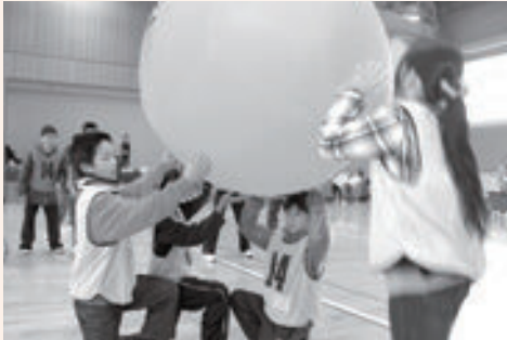
スポーツを通じて交流しました