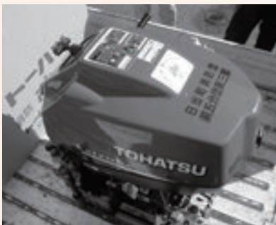
宝くじ助成金を使い購入したポンプ