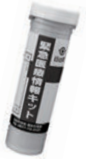
緊急医療情報キット