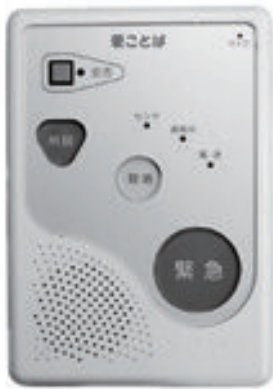
緊急通報システム