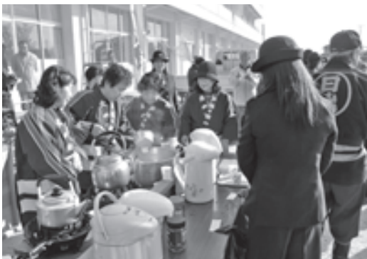
温かい飲み物を振る舞う 藤原南部防火クラブの皆さん