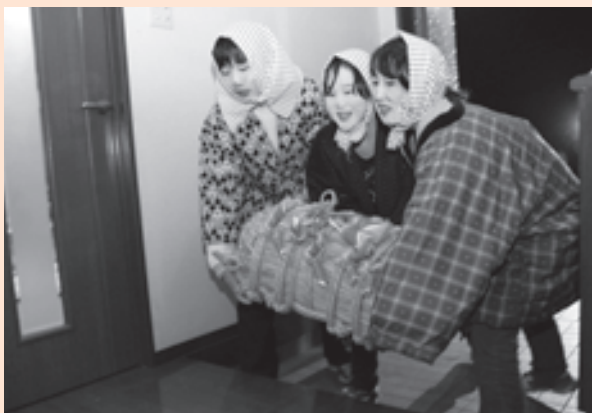
俵を投げ込む子どもたち