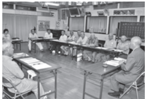
移動町長室の様子