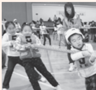
一生懸命に綱を引く子どもたち