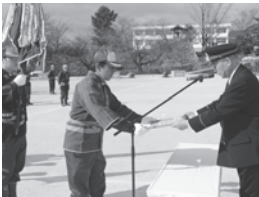
表彰を受ける団員