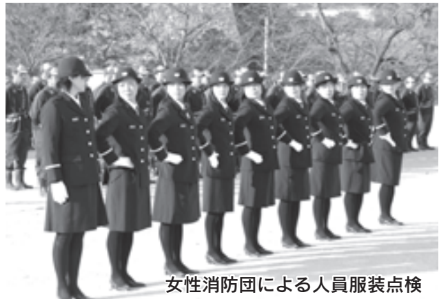
女性消防団による人員服装点検