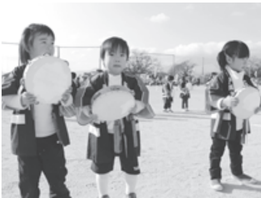
かわいい演技を披露する園児