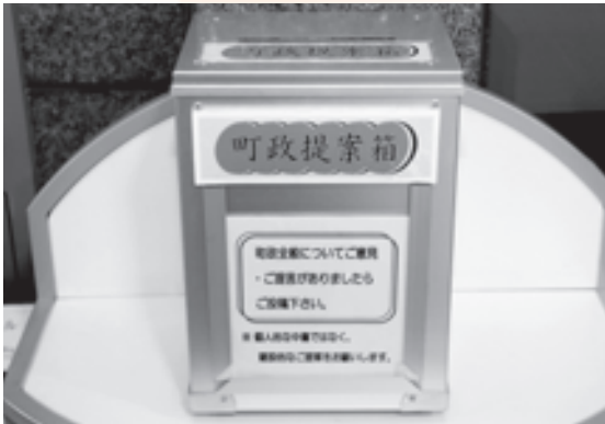
意見や提言をお待ちしています

届いた質問に対しては担当課と協議を行い、ホームページ等で対応を公表するとともに、投稿者が限定できれば直接返答を送っています。