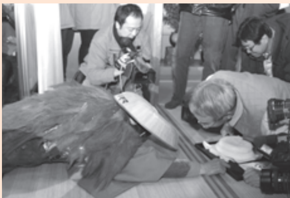
ユニークなやりとりに笑い声が広がる

この後、ハーモニークランドのキティちゃんが登場、抽選会を行い、会場は盛り上がりまりました。