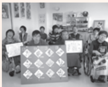
合作の部で大賞を受賞した「ゆうわ」の皆さん