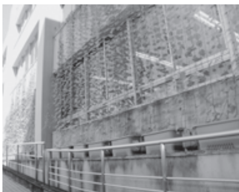
庁舎のグリーンカーテン化。昨年の様子

導入前に役場庁舎の一室で実験したところ、コーティング剤を塗布していない部屋に比べて、2度〜3度