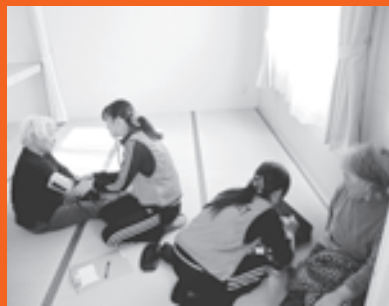
仮設住宅で被災者のケアにあたる日出町の派遣職員

これまで日出町では、被災地に対して、支援物資や義援金を送るなど、被災者支援を行ってきたところです。日出町としては、少しでも早い復興を願い、これからもできるだけの支援を行ってきたいと考えています。