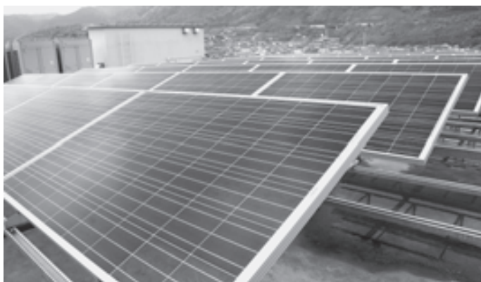
役場庁舎屋上の太陽光パネル

太陽光パネル設置から1年が経過しましたので、その効果と役場の省エネ対策について報告します。