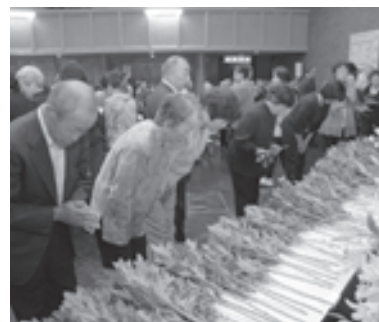
御霊に献花する参列者

6月3日、町中央公民館で日 出町戦没者追悼式が行われ、遺 族らおよそ250人が参列し、 724柱の安らかな眠りを祈り 献花しました。