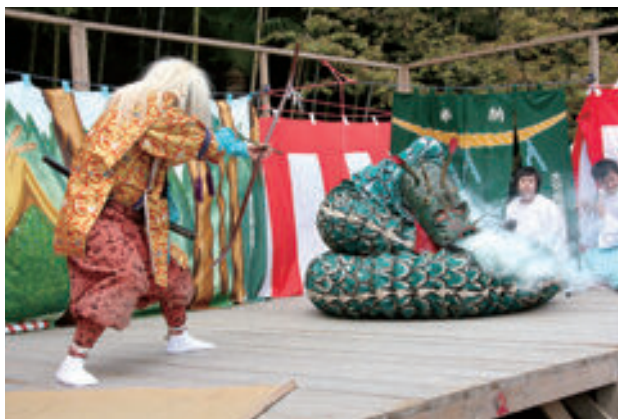
津嶋神楽の一場面。蛇切りの様子。

3種の演目からなる津嶋神楽。演目によっては、舞方と囃方 はやし あわせて9人が必要となるものもあります。11人では十分とはいえず、後継者不足に悩まされています。メンバーの高齢化も進みました。