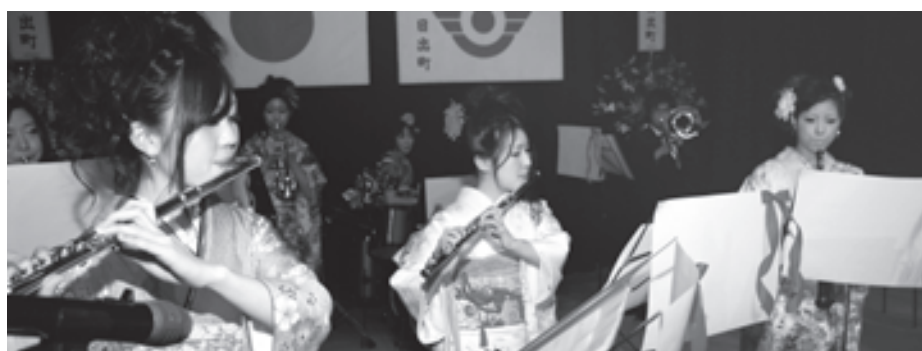
昨年の成人式の様子。日出中吹奏楽部OBによる演奏などを企画しました。