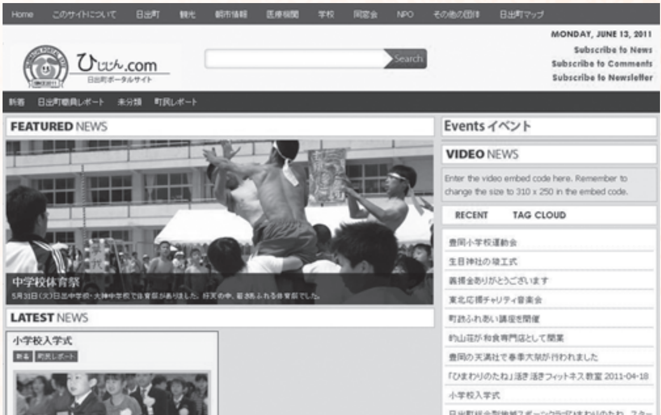
日出町ポータルサイトのトップページ