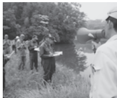
各機関で情報共有

6月8日、町内の災害危険箇所を巡回する「防災パトロール」を実施しました。 これは、雨の多くなるこの時期に、消防署、警察署、県、自衛隊、町など関係機関で、災害危険箇所の情報を共有しようと毎年行われています。 町では、急傾斜地などの危険場所を25箇所指定しており、この日は、老朽溜池や急傾斜地の3箇所をパトロール。 このあと、有事の際の連携体制や各機関の取組状況などを話し合いました。