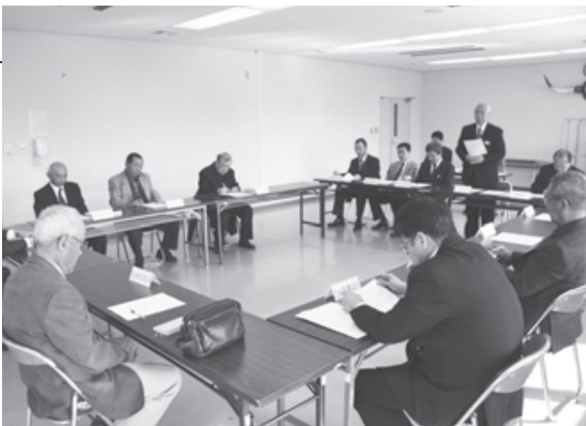
被災地への支援内容を検討

派遣期間は6月3日～11日までの9日間。避難所での健康相談や避難者の身の回りのお世話などを行います。