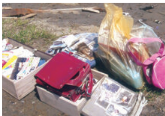
がれきの中から見つけた被災者の思い出の品

その後も現地に留まり、「思い出探し隊長」としてボランティア活動を続けました。がれきをかき分けながらアルバムや写