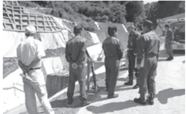
昨年度の防災パトロールの様子