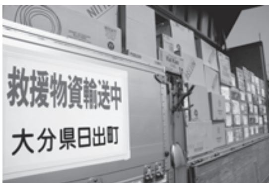
支援物資をトラックで搬送