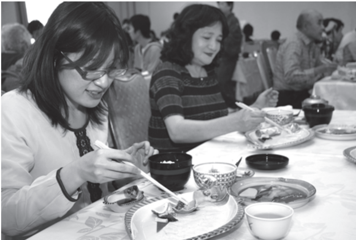
城下かれいの味を堪能