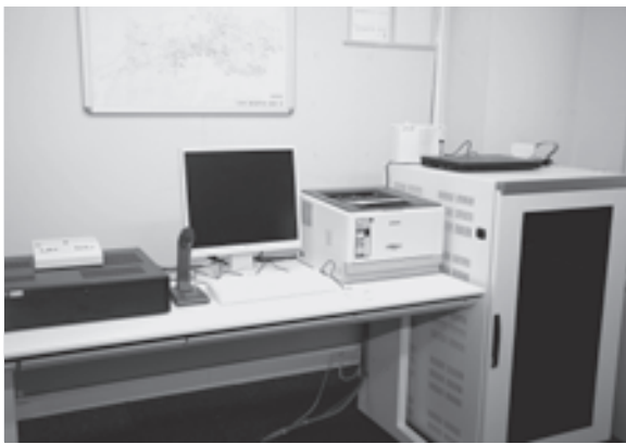
全国瞬時警報システム