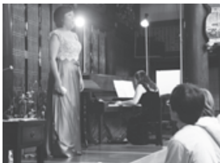
本堂に美しい音色が響きわたります