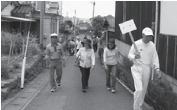
南区の津波避難訓練

また、インターネットで海拔を調べることができる地図サイトもあります。自宅のある場所の海拔を簡単に調べることができますので、参考にしてください。