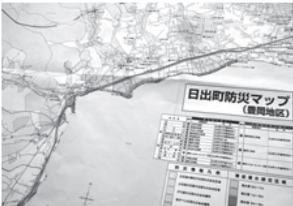
地区ごとに作成した防災マップ