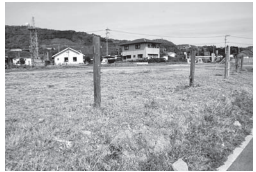
高校跡地のホテル進出予定地

会場には、特産品販売コーナーやお茶席などが設けられ、ステージでは、大正琴、豊岡保育園児による合唱やお遊戯、津軽三味線、辻間楽などが披露されました。春を感じさせる暖かい陽気の中、多くの人で賑わいました。