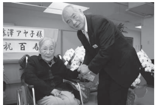
元気の源はよく食べること