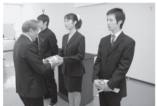
記念品の贈呈を受ける新入隊者