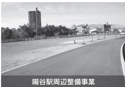
陽谷駅周辺整備事業