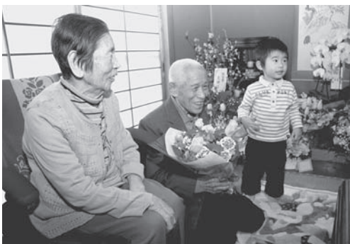
ひ孫からの花束に笑顔の章さん

好き嫌いなくなんでも食べることが長寿の秘訣と言う章さん。「妻と二人で過ごす毎日が本当に幸せなんです」と話します。