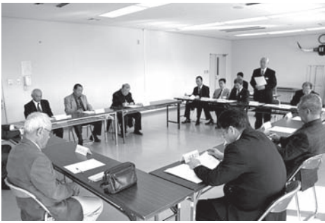
団体ごとの支援活動を報告