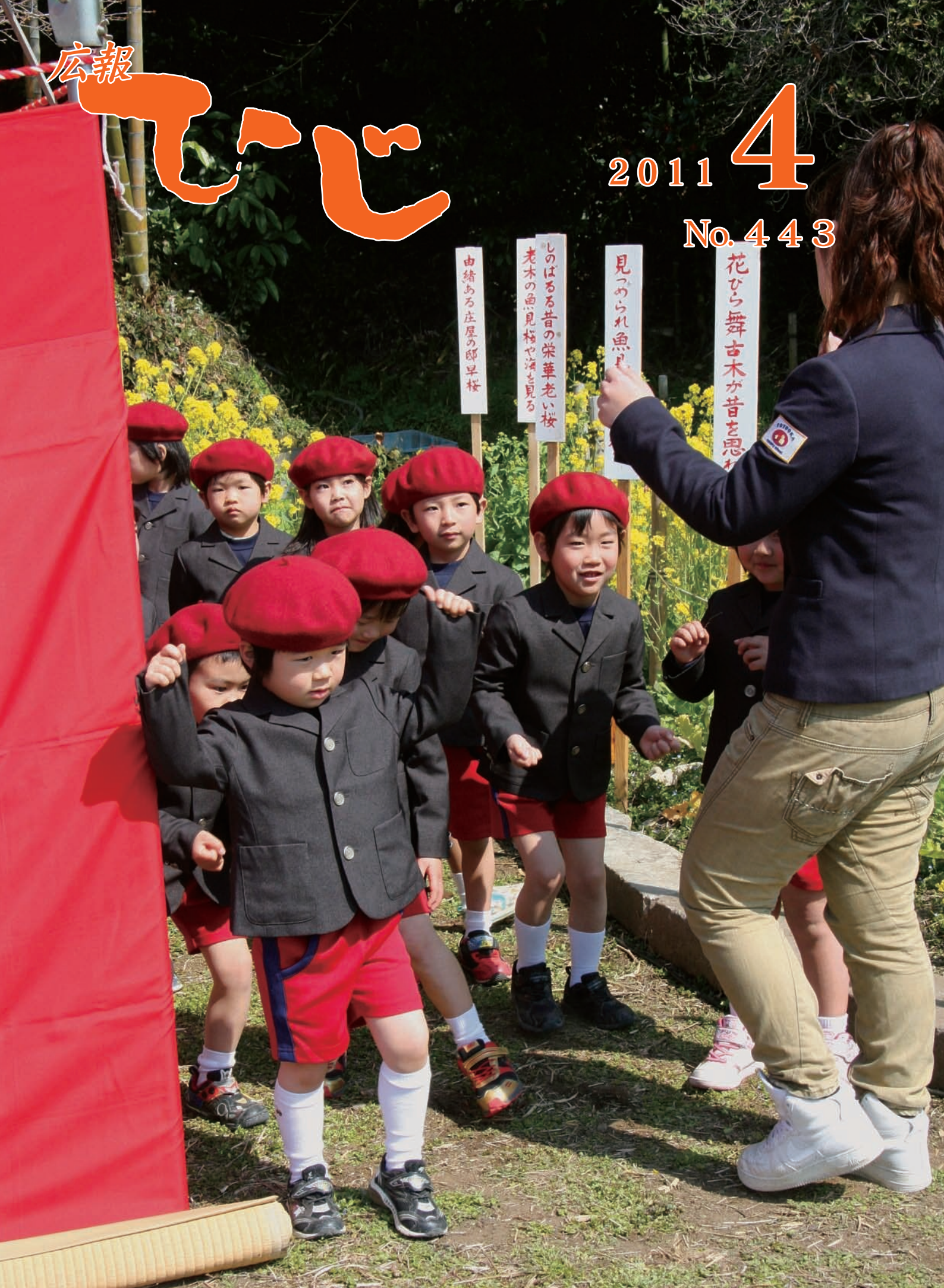
魚見桜まつりで。音楽に合わせて踊る豊岡保育園の園児。