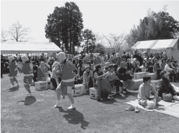
ひよっとこ踊りで盛り上がる会場