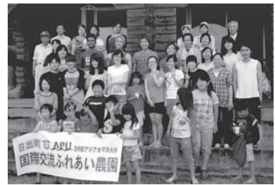
国際交流ふれあい農園