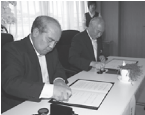
吉良署長と工藤町長が調印