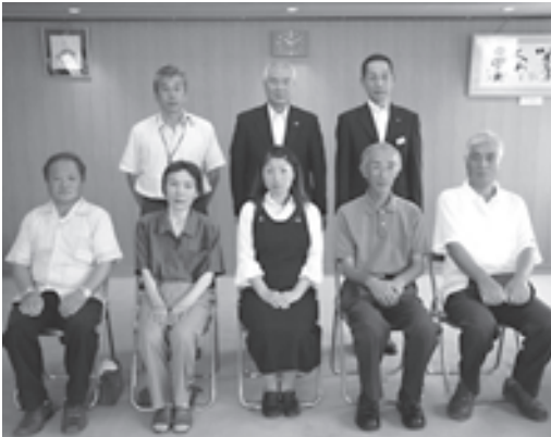
土地の無償提供者（前列）

また、今年から宝探しゲームも行われ、参加者は砂に埋められた宝の名前が書かれた石を一生懸命に探しました。