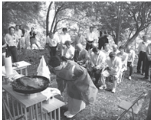
水の恵みに感謝して

この水源地からの湧水量は日量約1万2千トンで、町内の上水道の1日の使用量約1万トンの内、約4千トンをまかっています。