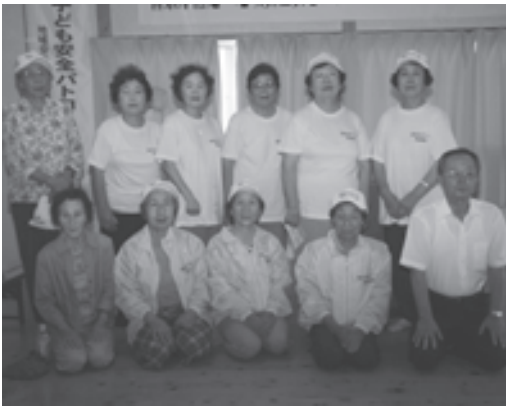
地域の安全を見守る