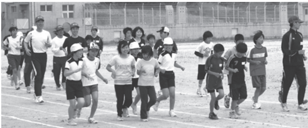
世代を超え、一緒に練習する陸上教室

健康で豊かなライフスタイルを送るための生涯スポーツとしてとらえ、みんなが楽しくスポーツを行い、元気なまちづくりを目指します。