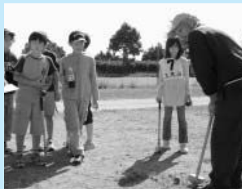
大神地区のグラウンドゴルフ大会