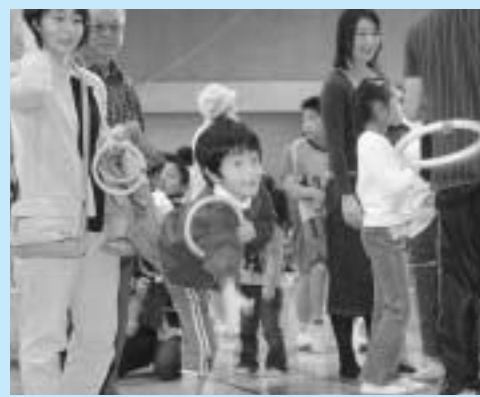
家族で楽しむ、日出地区での輪投げ