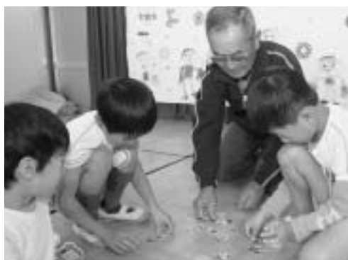
めんこの遊び方を教えてもらう園児