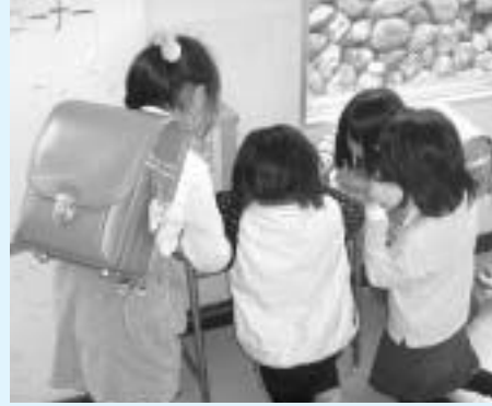
蘭蘭コーナーに投稿する子ども