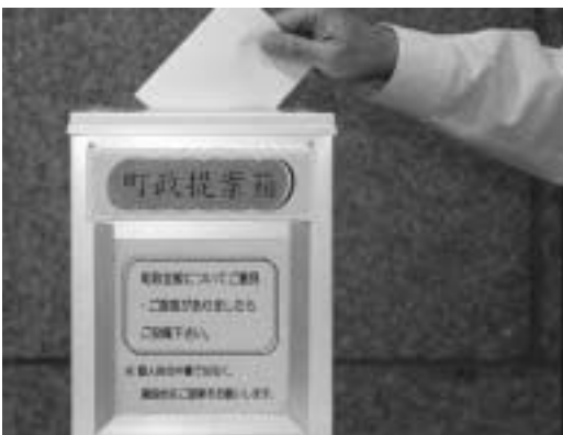
町政に対しての意見や要望はこの中へ

平成19年度は、接客サービス6件、町有施設管理5件、生活環境の整備とつづきます。