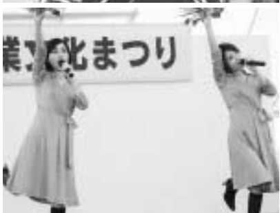
大分県出身の歌手 大分姉妹