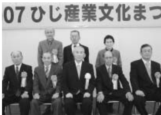
被表彰者のみなさん

旧日出町漁協時に監事として漁協の再建に尽力。支店が実施している車えび等の中間育成事業に積極的に参加。水産資源の保護、水産業の発展に寄与されました。