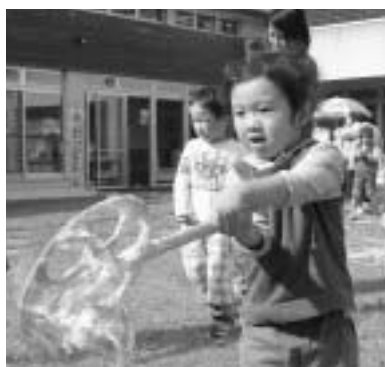
シャボン玉で遊ぶ子ども

子どもたちは、シャボン玉や竹を使った紙鉄砲、ストローを使った飛行機や笛などで遊び、「赤ちゃんピック」のハイハイレースでは、かわいい赤ちゃんたちがお母さん