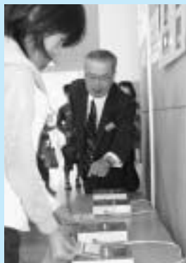
カードをかざす児童

式では、藤田町教育長が「今日からは確実にカードをかざし、登下校の道のりを心配している保護者を安心させてください」とあい