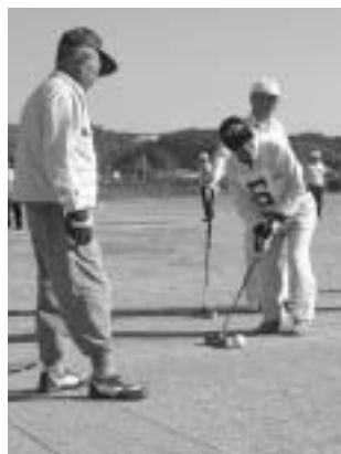
ゲートボール大会