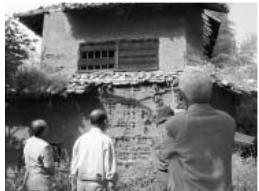
隅櫓の保存状態を調べる文化財保護委員

この調査は、年3回地区ごとに行われており、今回は日出地区の隅櫓（すみやぐら）や裏門櫓など4ヶ所、藤原地区の赤松橋や安養寺経塚古墳など4ヶ所をパトロールしました。