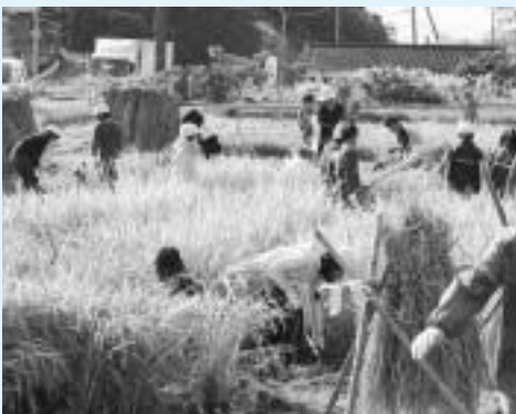
稲刈りを体験する子ども

このような活動をおして、子どもたちは地域の方々に暖かく見守られているということに改めて実感しました。