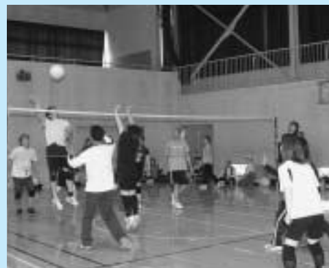
豊岡地区ミニバレーボール大会